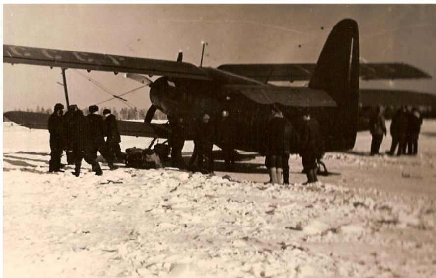
Самолет АН-2 на аэродроме Арамиль для группы спасателей

Туристов пришло не очень много и большинство с младших курсов, поскольку сессия у старшекурсников всегда начиналась раньше нашей. Группу собрали относительно быстро. Меня назначили руководителем. Распределили обязанности: кто-то занялся снаряжением, кто-то продуктами. Я сходил в суворовское училище за ракетницами, картами нам обещали помочь в Ивделе, куда мы рано утром должны были вылететь спецрейсом с армейского аэродрома Арамиль. Для меня этот полет был первым в жизни, хотя на военной кафедре из нас должны были сделать штурманов десантной авиации.