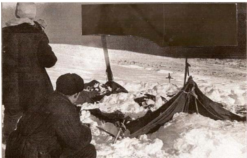
Спасатели около оставленной группой Дятлова палатки

Наконец, уперлись в палатку, стоим, молчим и не знаем, что делать: скат палатки в центре разорван, внутри снег, какие-то вещи, торчат лыжи, у входа воткнут в снег ледоруб, людей не видно, страшно аж жуть!